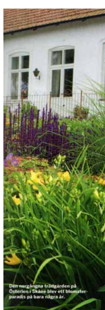
Den nergångna trädgården på Österlen i Skåne blev ett blomsterparadis på bara några år.

Bakom paradrabatterna finns smårabatter med lekfulla varianter av de storas färgkombinationer i oregelbundna former. I skuggan och vid dammen finns växter med spännande blad. I den del som kallas för