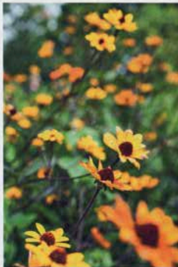
Dageje, Heliopsis helianthoides var. scabra 'Summer Nights'. Gyldne, gule blomster med brun midte og mørke stilke. En sensommerfavorit, der lyser op. Lad den bare ikke stå for tart.