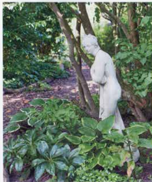
Statuen af den græske Pandora er lavet i England og står i skovhaven.