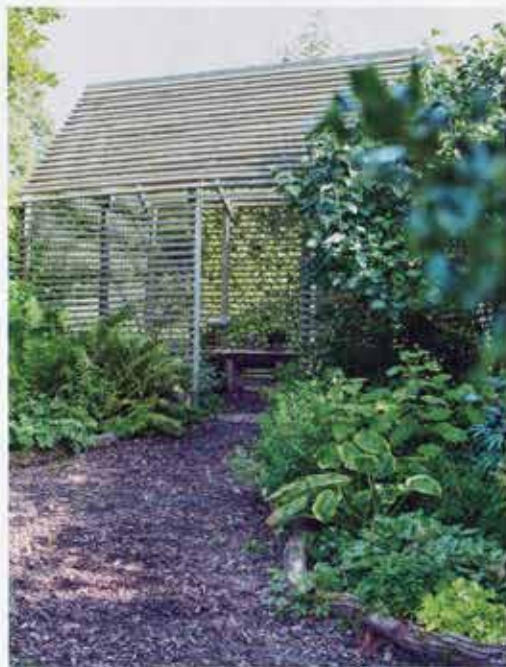
Skyggehøuset ligger i skovhaven. Det kendes også fra England og bruges til at dyrke skyggekrævende planter som bl.a. hosta.