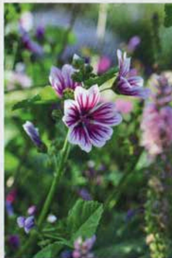
Almindelig katost, Malva sylvestris 'Zebrina'. Stribede blomster i rosalilla og hvid. En rigtig bedstemorplante, der er let at elske.