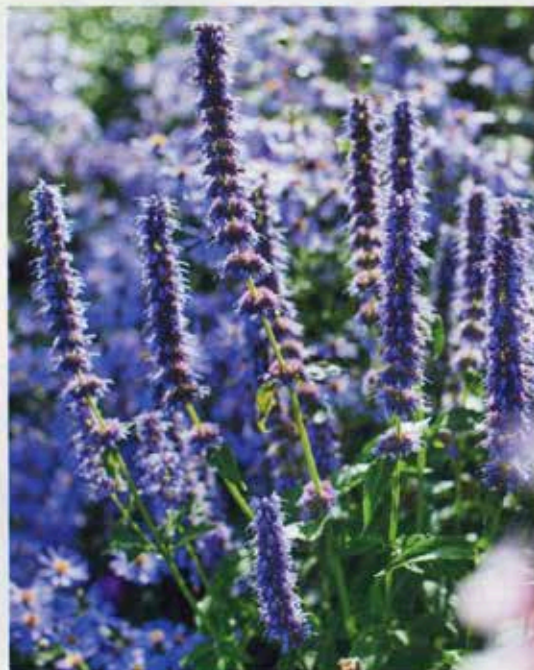
Indianermynte, Agastache 'Blue Fortune'. Lang blomstring med vidunderlige, blå spir og en dejlig duft i sensommeren. Sørg for at skære dem ned efter blomstringen, ellers selvsår de sig lidt for vildt.