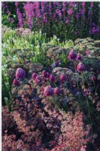
Middelhavsprydøl, Allium sphaerocephalon . En sen art af prydløg med små, rødvinfarvede kugler, der stolt viser sig frem i sensommerbedet. Sjøvt indslag i bedet.