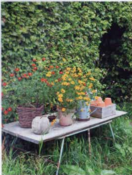
Lille opstilling med forskellige sommerblomster, fx opret fløjlsblomst, Tagetes erecta, i rødorange farver.