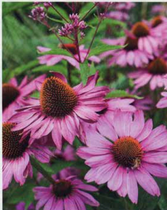
Havepurpursolhat, Echinacea purpurea 'Magnus'. Standhaftige og stilige blomster, der giver højde til bedet. Blomstrer i lang tid og tiltrækker sommerfugle og bier.