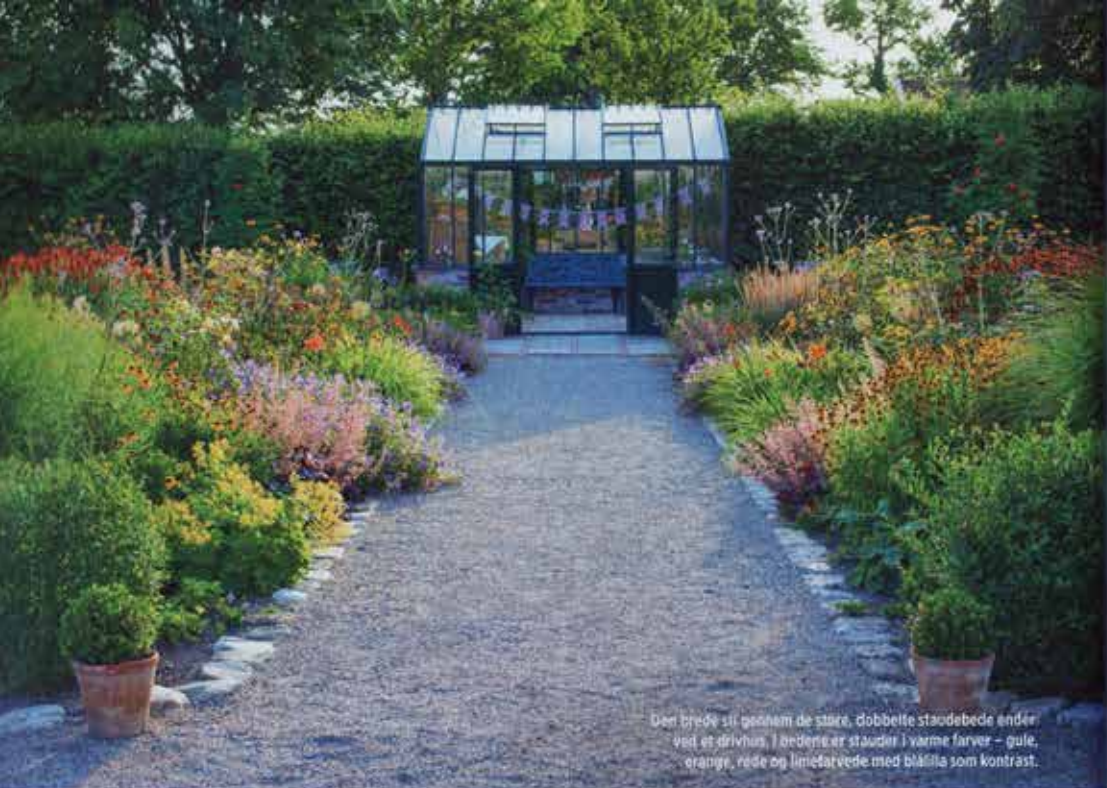
Den brede sti gennem de store, dobbelte studebede ender ved et drivhus. I bedene er stauder i varme farver – gule, orange, røde og limefarvede med blåflå som kontrast.