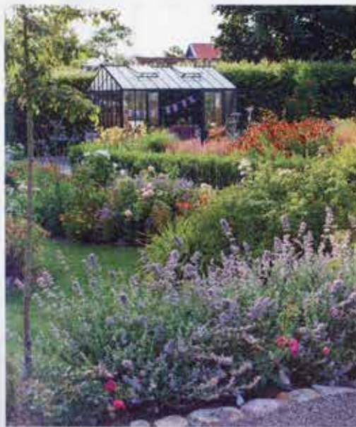
Et kig over rosenhaven til drivhus og stauedebede med, bl.a. flammende rød fra solbrud, Helianthus , 'Moerheim Beauty' til højre.